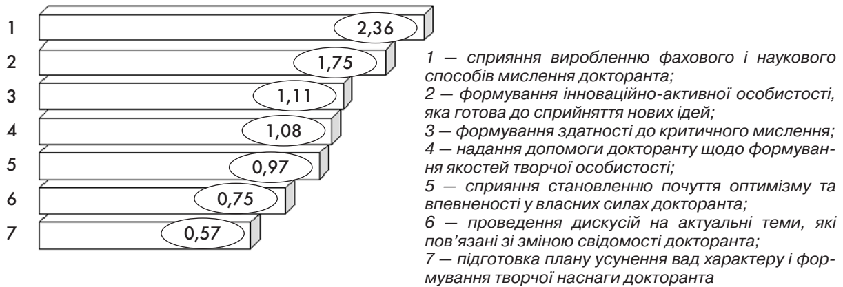
Рис. 4. Роль наукового консультанта у виробленні нового способу мислення докторанта філософії, інтегральні показники

ня якостей творчої особистості докторанта філософії (1,08), становленню почуття впевненості докторанта у власних силах та наявність оптимізму щодо успішного виконання докторської дисертації (0,97).