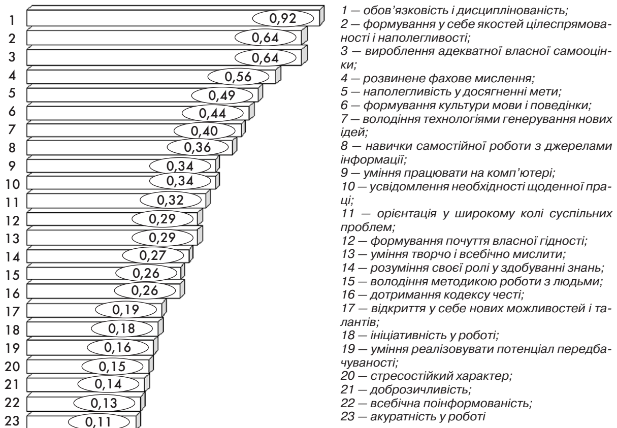
Рис. 5. Напрями самовдосконалення докторанта філософії як творчої особистості, інтегральні показники

способу мислення докторанта філософії, як підготовка плану усунення вад характеру і розвиток творчої насаги, а також проведення дискусій на актуальні теми, які пов'язані зі зміною стереотипів свідомості докторанта, становили відповідно 0,57 та 0,75 відносних одиниць і посіли 6-те та 7-ме рангові місця.