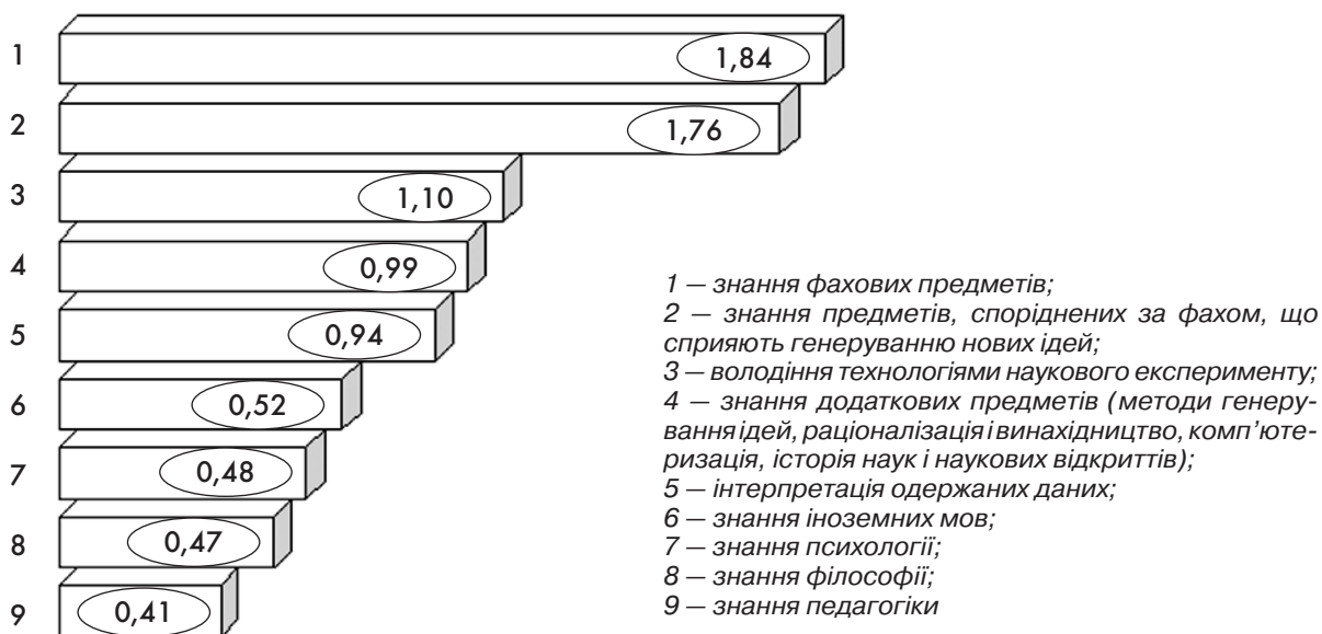
Рис. 1. Знання та навички, що потребують формування протягом навчання у докторантурі – інтегральні показники

Отримані в процесі дослідження дані вказують, що найважливішими серед знань та навичок, які потрібні докторанту, є знання предметів (модулів) за фахом (інтегральний показник – 1,84), споріднених за спеціальністю дисциплін (1,76), володіння технологіями наукового експерименту (1,10),