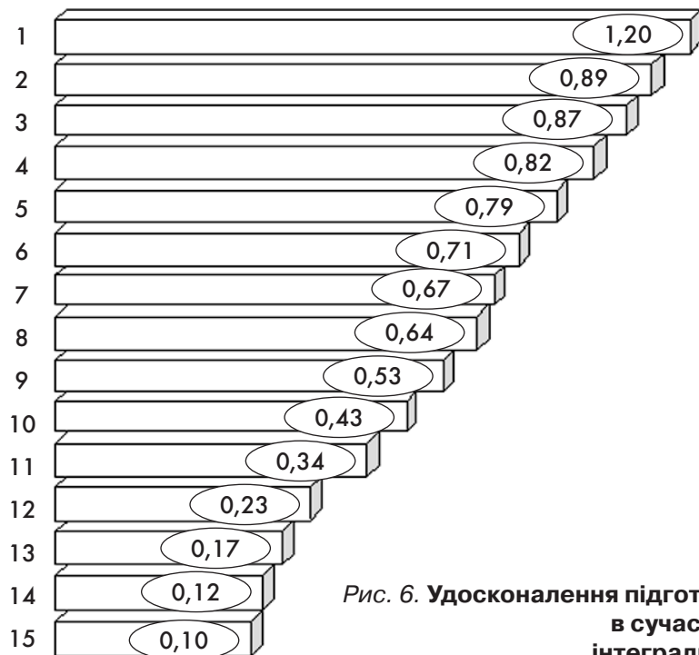
Рис. 6. Удосконалення підготовки докторантів філософії (PhD) в сучасних умовах, інтегральні показники

Серед 23 досліджених напрямів самовдосконалення докторанта філософії як творчої особистості найменші інтегральні показники