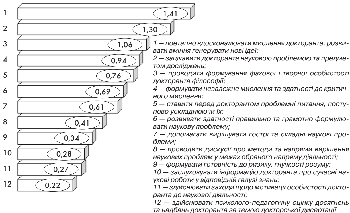
Рис. 3. Роль наукового керівника у підготовці докторантів філософії, інтегральні показники

Важливою інтегральною психологічною якістю докторанта філософії є формування і розвиток нового способу мислення, яке генерується такими ролями наукового керівника (рис. 4): сприянням виробленню фахового і наукового способів мислення докторанта (2,36), формуванню соціально-психологічних якостей інноваційно-активної особистості, яка здатна до сприйняття нових наукових ідей, подолання існуючих стереотипів і психологічних бар'єрів при впровадженні результатів наукових досліджень (1,75), розвитку здатності до критичного науково-дослідного мислення (1,11), сприянню щодо формуван-