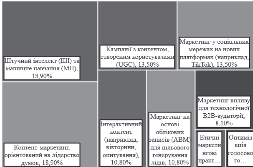
Найважливіші тенденції цифрового маркетингу, що змінюють ландшафт ІТ та технологій