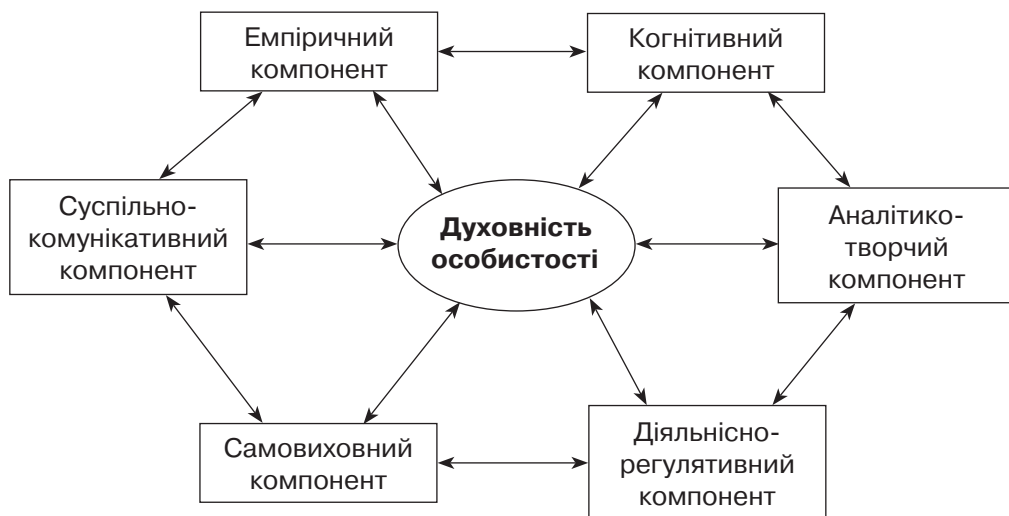
Рис. 2. Зв'язки між компонентами духовності особистості

Структура духовності особистості, зокрема дитини, виступає водночас цілісною, складною, статичною і динамічною системою, яка відображає зміст і структуру виховання та характеризує його найважливіші якісні сторони. Структурні компоненти духовності є основою визначення її головних критеріїв: змісто-