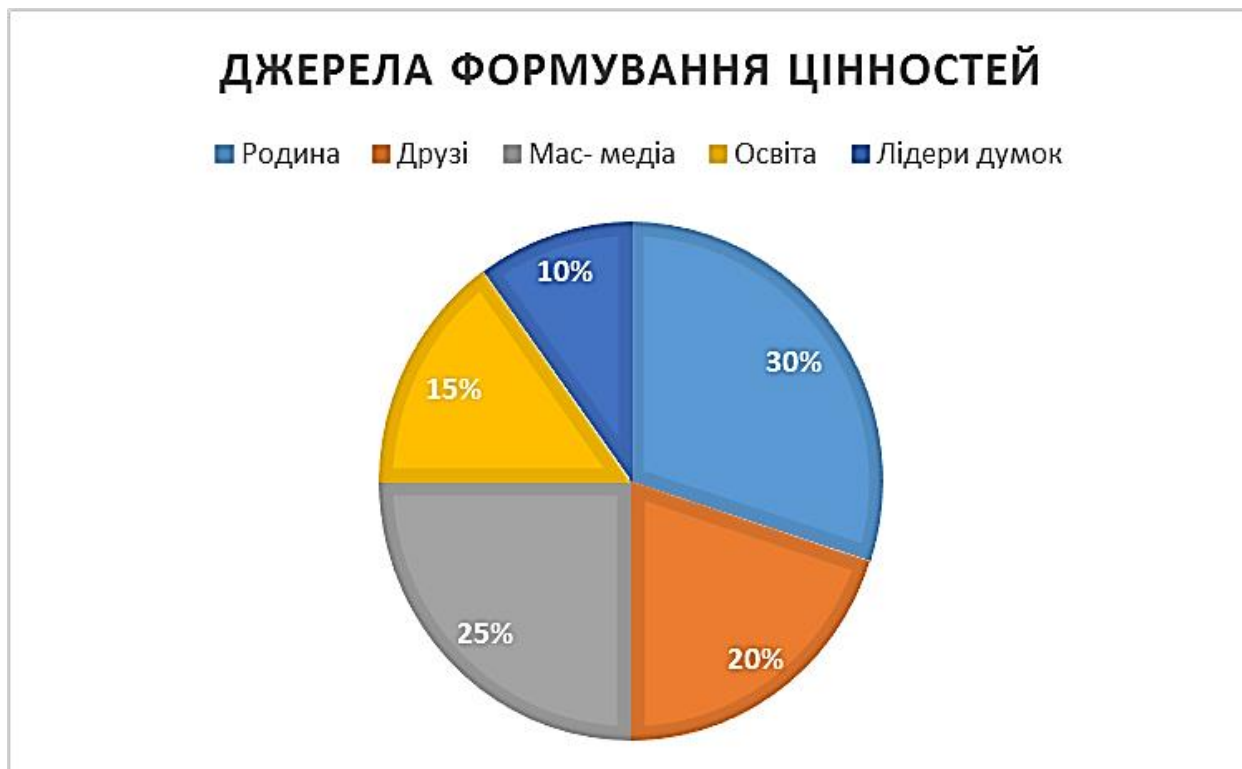
Рис.2.4. Вплив медіа на цінності.

Висновок: значна частка респондентів проводить понад 2 години в соціальних мережах (підтвердження емпіричних даних — 78%). Відповідь на запитання 5 (Додаток 1)