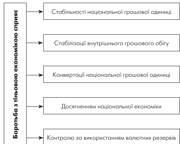
Рис. 3. Макроекономічні показники, які розвиваються, коли відбувається боротьба з тіньовою економікою

міки, зростання злочинності, які, зрештою, призводять до втрати суспільної моралі в державі і безперспективності розвитку суспільства. В умовах ринкової економіки економічна культура має принципово важливе значення для всіх категорій громадян: від школярів до робітників і службовців усіх сфер діяльності; військових і осіб пенсійного віку. Як зазначають вчені, політики [4, 6, 7, 12, 16], ринкова безграмотність, особливо фахівців юридичного профілю, сприяє породженню корупції, тіньової економіки, зростанню злочинності. Саме на ці ознаки вказує економічна культура, точніше, — її відсутність (рис. 3).