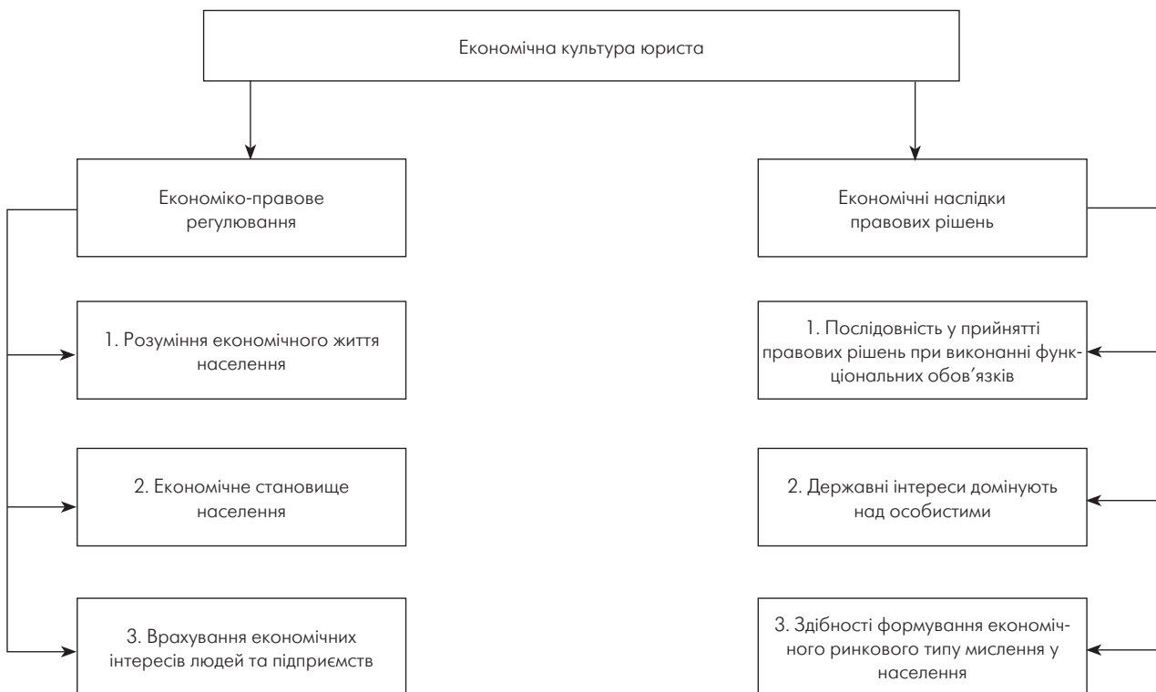
Рис. 1. Значення економічної культури юриста на макроекономічному рівні

У цьому плані можна вказати на деякі дослідження економічної культури юриста: спробу мобілізувати освітні системи до ефективної діяльності із розробки економічної формули юриста як з врахуванням потреб ринку, так і впровадженням здобутих досягнень у практику. Дослідження питань економічної культури розглядали більш широке розуміння юристом сутності економічних реформ, які відбуваються в державі; захист вітчизняного виробника в процесі виконання своїх професійних обов'язків [7, 10, 12, 15] (рис. 2).