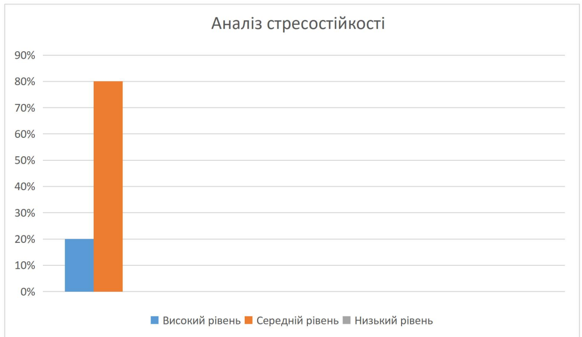
Рис 2.1. Відсотковий розподіл студентів-психологів за рівнями стресостійкості (шкала CD-RISC-10)

демонструють щонайменше базову здатність до подолання стресових ситуацій.