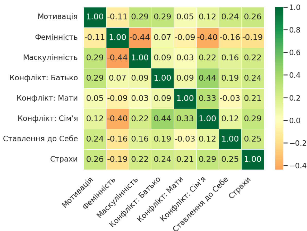
Матриця взаємозв'язків: чинники впливу на самореалізацію

Ця процедура детермінує перехід від розрізнених результатів тестування до цілісної математичної структури. Формалізація емпіричного матеріалу створює необхідні умови для подальшого імітаційного моделювання, перетворюючи статичні дані на динамічні параметри системи. Це нівелює ризики фрагментарної інтерпретації та дозволяє оперувати психологічними феноменами як взаємозалежними величинами.