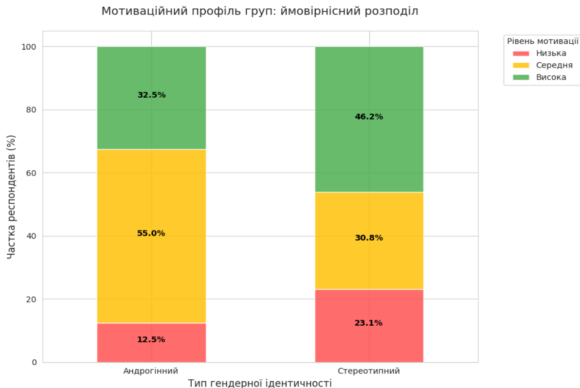
Рисунок 2.2. Мотиваційний профіль груп: ймовірний розподіл

Полярність показників у маскулінних та фемінних підлітків зумовлює лабільність самооцінки, яка залежить від зовнішнього підтвердження гендерної ролі. Алгоритмічне опрацювання даних виявляє функцію андрогінності як стабілізуючого механізму, що зменшує коливання у мотиваційній структурі. Жорстка стереотипізація обмежує адаптивний потенціал, роблячи суб'єкта вразливим до соціального пресингу.