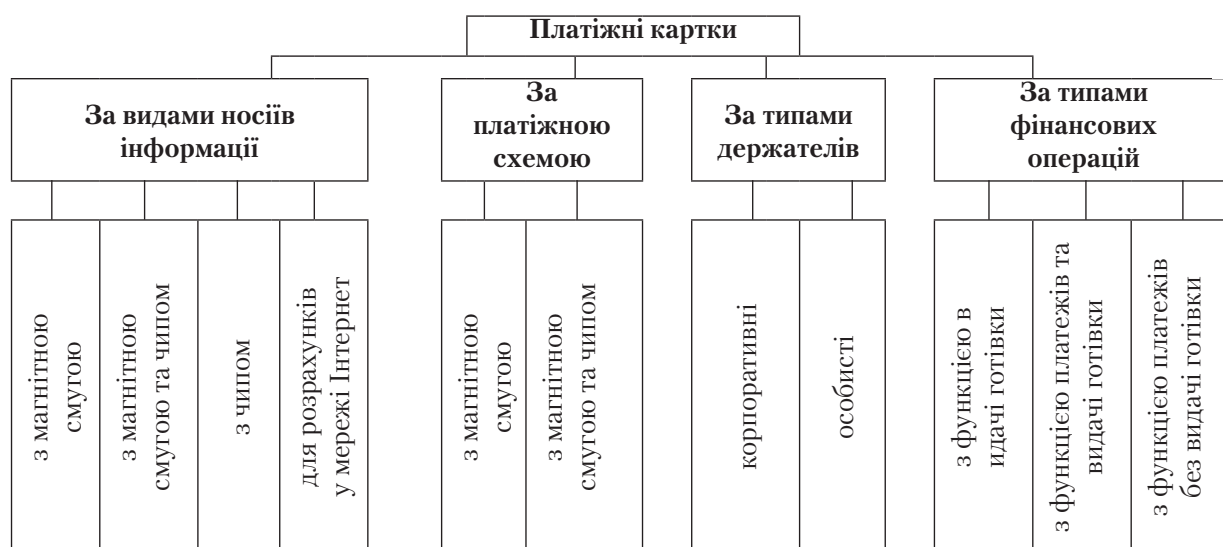
Рис. 2. Види платіжних карток, які емітовані українськими банками