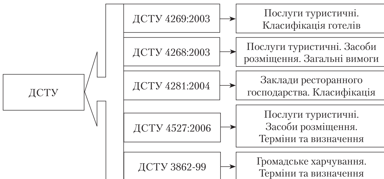
Рис. 3. Державні стандарти України, що встановлюють вимоги та правила здійснення діяльності суб'єктами туристичної індустрії

Державні стандарти України, що встановлюють вимоги та правила здійснення діяльності суб'єктами туристичної індустрії представлено на рис. 3.