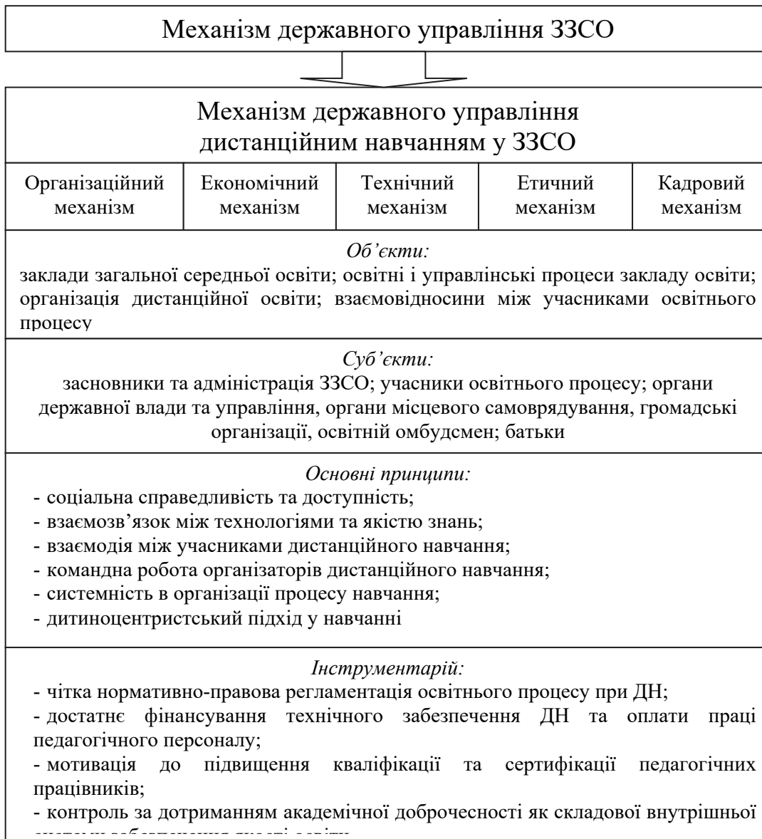
Рис. 2. Механізм державного управління дистанційним навчанням у ЗЗСО