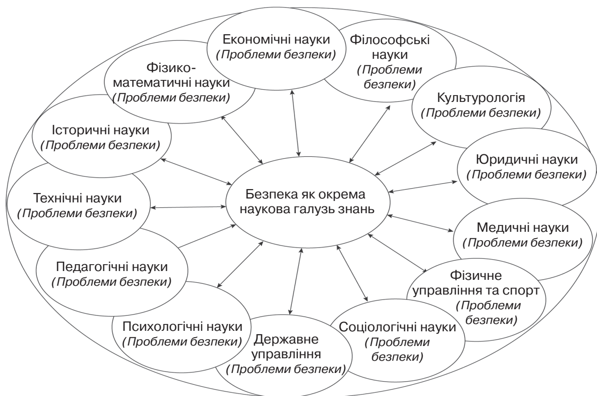
Рис. 1. Безпека як інтегральна галузь наукових знань

Розглядаючи національну безпеку як окрему наукову галузь (рис. 1.), ми маємо зро-