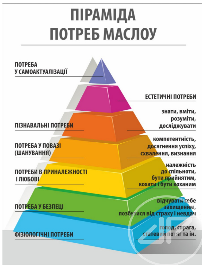
Рис. 3. Ієрархія потреб Маслоу

• Четвертий блок. Структура людського суспільства. Продовження і розширення попередньої тематики. Використовуючи набуті в процесі навчання історико-географічні знання, телемедійну інформацію, власний досвід і спостереження, скласти соціальну структуру суспільства різних історичних періодів на різних територіях, різних народностей. Прослідкувати історичні зміни в складі структур. Скласти їх ієрархію за ступенем пріоритетності, важливості на кожному етапі. Виокремити функції кожної. Порівняти. Дати оцінку. Розраховано на 3 заняття.