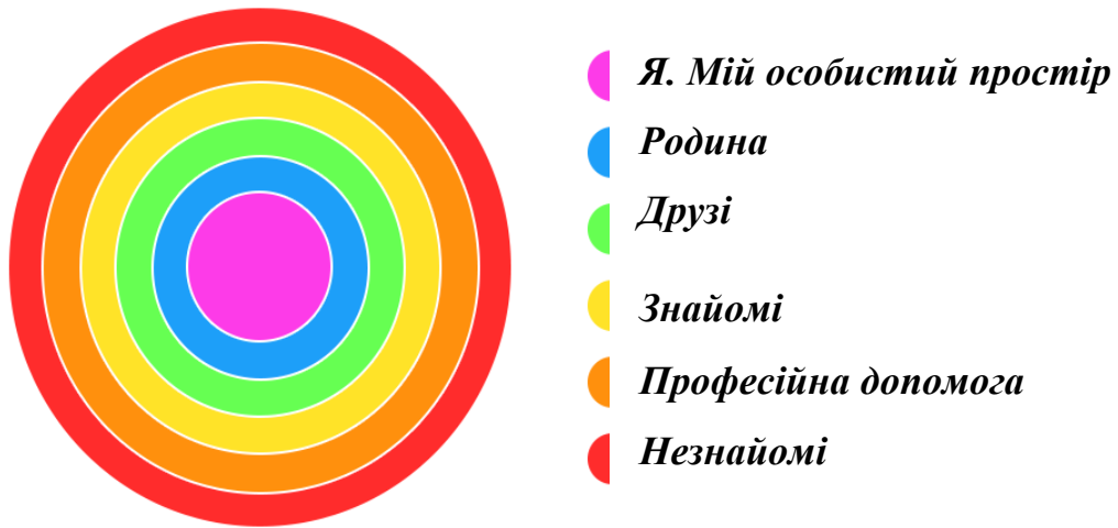
Рис. 1. «Кола спілкування» (соціальні кола)

• Другий блок. «Коло життя» (рис. 2). Завдання цього блоку - окреслити сфери діяльності в житті людини. Спочатку навчити розмежуванню таких понять, як робота, відпочинок, навчання тощо, підштовхнути до розуміння, що кожен крок, дію чи бездіяльність можна віднести до відповідної категорії. Потім визначити ієрархічність відповідних сфер. Розробці теми присвячено 2 заняття.