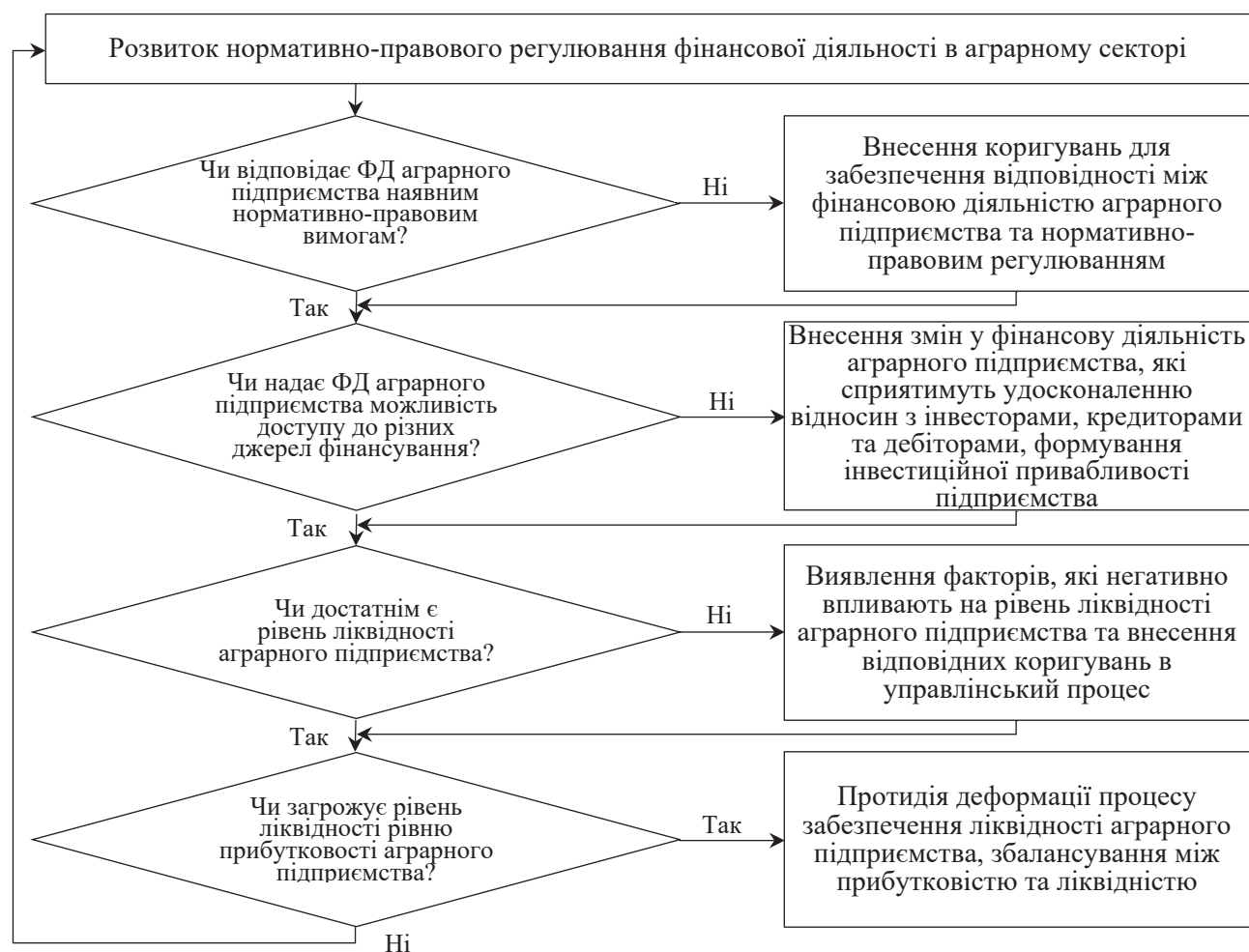
Рис. 3. Структурно-логічна послідовність управління розвитком фінансової діяльності аграрних підприємств

Висновки. Обґрунтовано, що завдання управління розвитком фінансової діяльності підприємства тваринництва постійно змінюються, тому їх необхідно визначати відповідно до стадії розвитку та специфічних характеристик кожного окремого підприємства. Зазначено, що формування завдань повинно спиратися на такі принципи: безперервності, послідовності, поступовості, неоднаковості