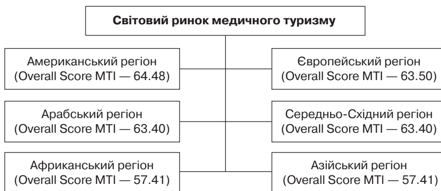
Рис. 2. Класифікація мегадестинацій медичного туризму (розроблено за даними Medical Tourism Index 2016 р.)