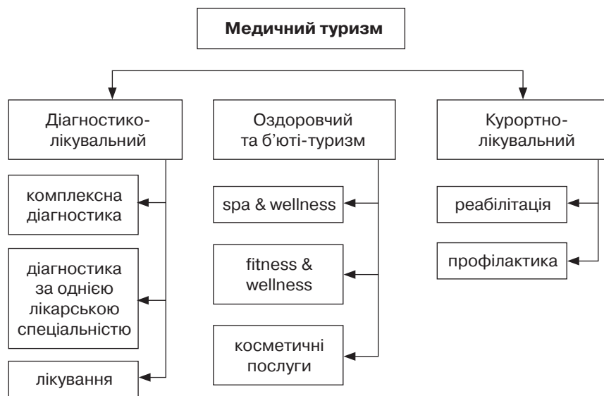
Рис. 4. Класифікація медичного туризму за видами (авторська розробка)

Діагностико-лікувальний туризм – подорожі в акредитовані заклади охорони здоров'я або до конкретних лікарів з метою