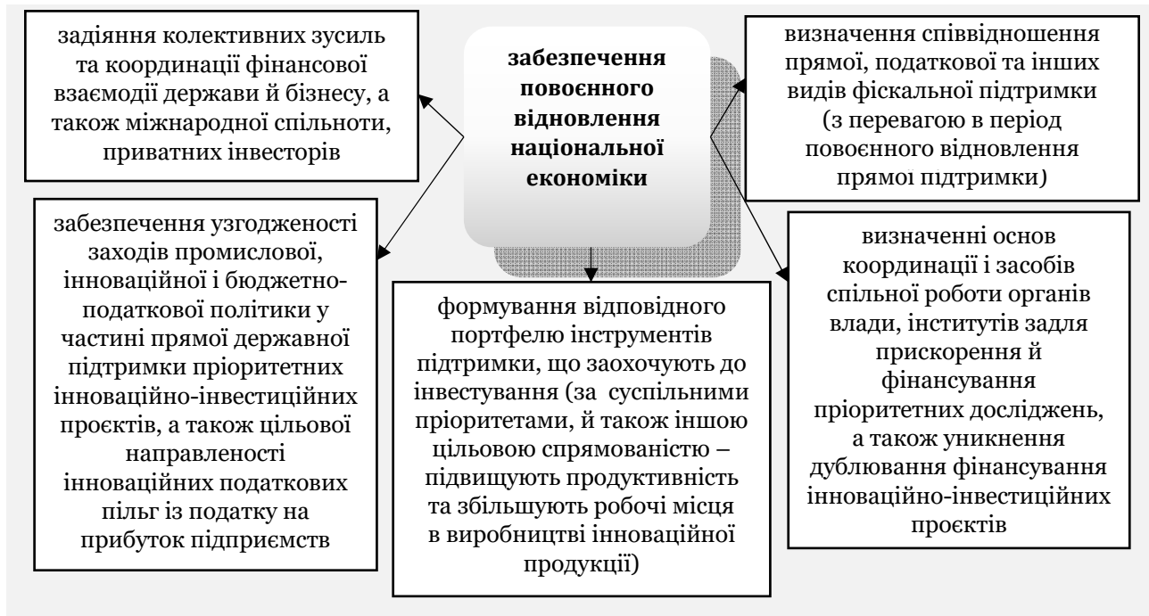
Рис. 3. Особливості забезпечення повоєнного відновлення економіки України