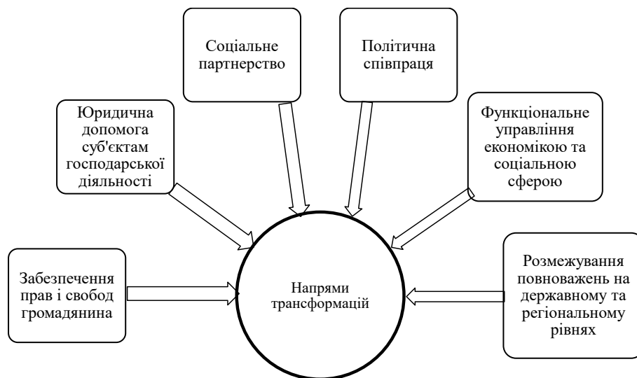
Рис. 2. Напрями трансформацій механізму державного управління розвитком регіонів, складено на основі аналізу джерела [9, с. 51]

– створення умов залучення інвестицій у перспективні напрями регіонального розвитку; – забезпечення позиціонування регіону для внутрішніх інвесторів з урахуванням перспектив його потенційних можливостей; – створення чіткої системи розподілу інвестицій та визначення повноважень регіональної влади щодо розвитку інвестиційної економіки; – встановлення відповідальності регіональної влади за використання інвестиційних коштів; – формування системи звітування щодо перспектив подальшого розвитку; – забезпечення взаємодії регіональних урядів з міжнародними фінансовими інститутами та державними організаціями для обміну досвідом та пошуку шляхів залучення додаткових інвестицій [6, с. 48]. Отже, необхідно підкреслити, що застосування зазначеного алгоритму для розробки механізму державного управління регіональним розвитком має на меті підвищення ефективності державного управління та забезпечення розвитку економіки та соціальної