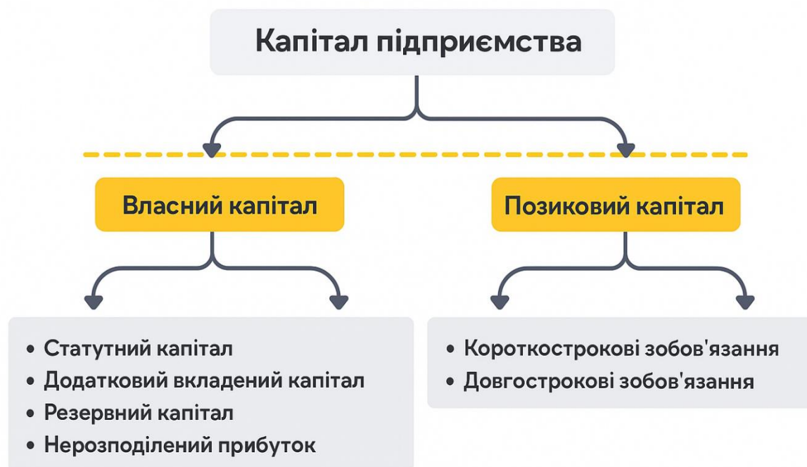
Рис. 1.1. Структура капіталу підприємства

Невід'ємною частиною структури власного капіталу є нерозподілений прибуток, тобто та частина чистого прибутку, яка не була виплачена у вигляді дивідендів, а залишилася на підприємстві для фінансування майбутньої діяльності. Цей компонент формується з результатів попередніх періодів і є одним із головних джерел самофінансування.