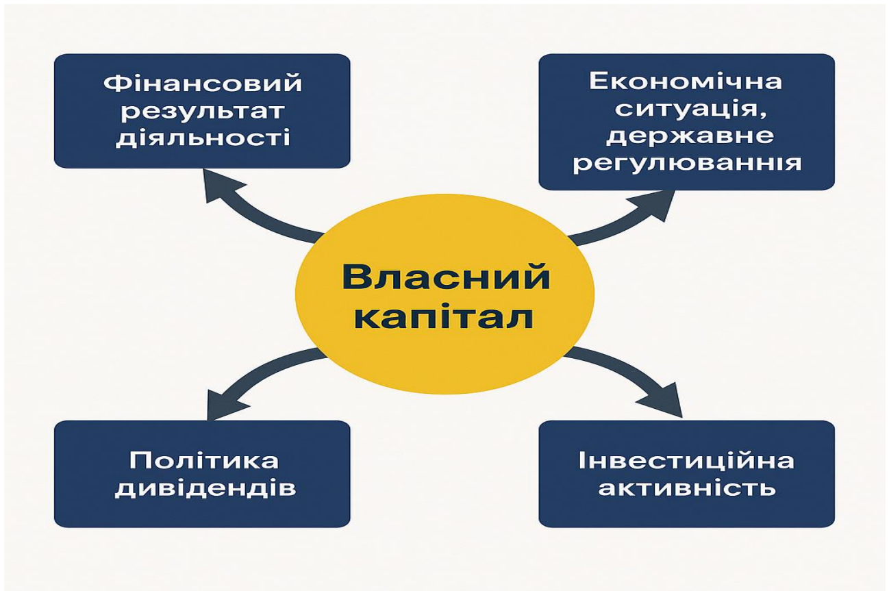
Рис. 1.2. Основні фактори, що впливають на динаміку власного капіталу підприємства

Таким чином, управління динамікою власного капіталу потребує системного підходу, який поєднує як контроль за внутрішніми параметрами, так і постійний моніторинг зовнішнього середовища. Раціональна політика щодо прибутку, інвестицій, дивідендів і структури фінансування здатна забезпечити сталий розвиток і фінансову стабільність підприємства у ринкових умовах. Управлінські рішення мають враховувати як стратегічні, так і тактичні цілі щодо формування капіталу