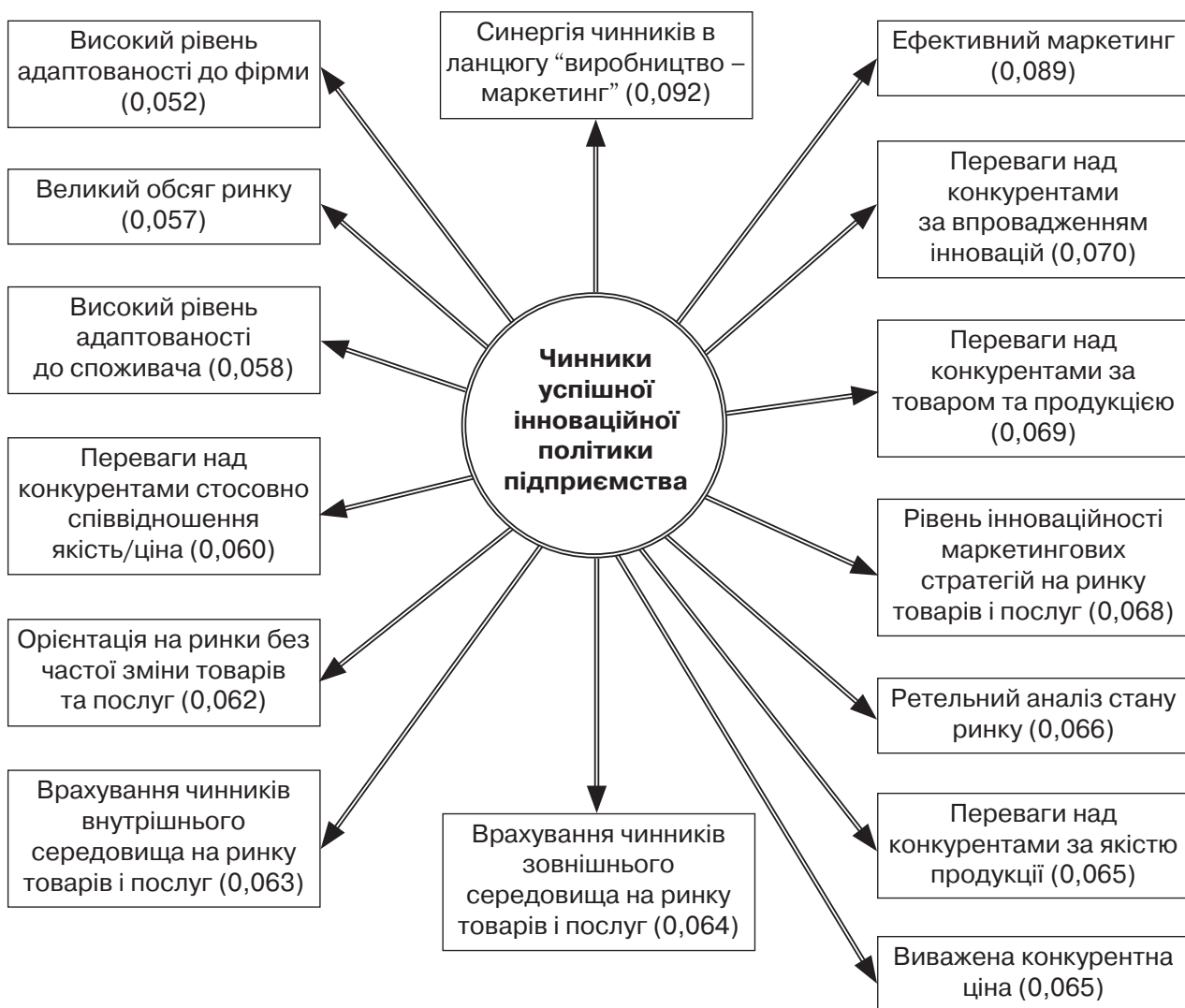
Рис. 2. Структура та вагомість чинників, які забезпечують успішність інноваційної політики економічного розвитку підприємства, відносні одиниці

Для забезпечення успішної інноваційної політики економічного розвитку підприємства нами визначено структуру та здійснено експертну оцінку вагомості 15-ти провідних чинників, які забезпечують її успішність (рис. 2).