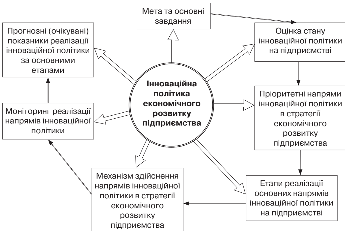
Рис. 1. Структурно-функціональна модель взаємозв'язку основних розділів інноваційної політики в економічному розвитку підприємства

Отже якісного економічного зростання, високого рівня конкурентоспроможності, гідного місця у світовому розподілі праці в сучасний період можливо досягти лише в умовах суспільства та економіки знань. За висновками Європейської комісії, через 10 років рівень технологічного розвитку на 80 % перевищуватиме сучасний, тоді як рівень кваліфікації економічно активного населення на 80 % буде недостатнім [7].