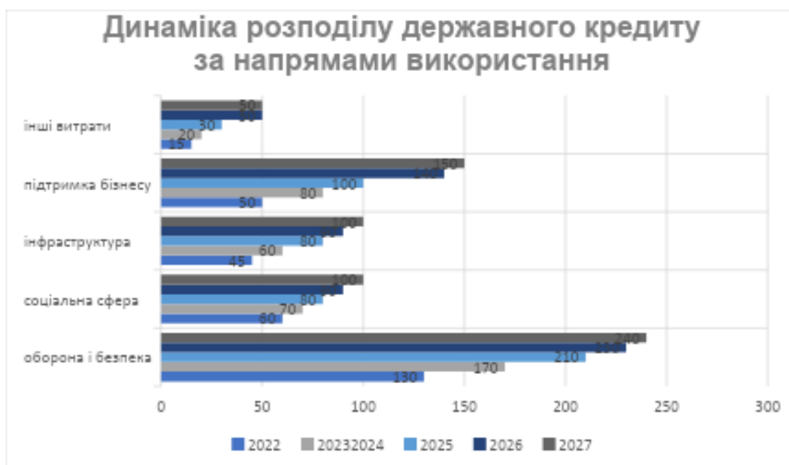
Рис.2.5. – Динаміка розподілу державного кредиту за напрямами використання за 2022-2026 роки (млрд грн)

Джерело: створено з використанням [9, 14, 29]