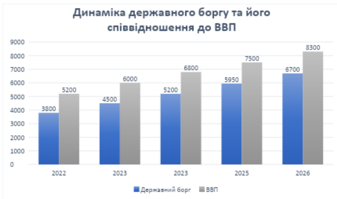
Рис.2.3. - Динаміка державного боргу України та його співвідношення до ВВП за 2022–2026 роки (млрд.грн.)