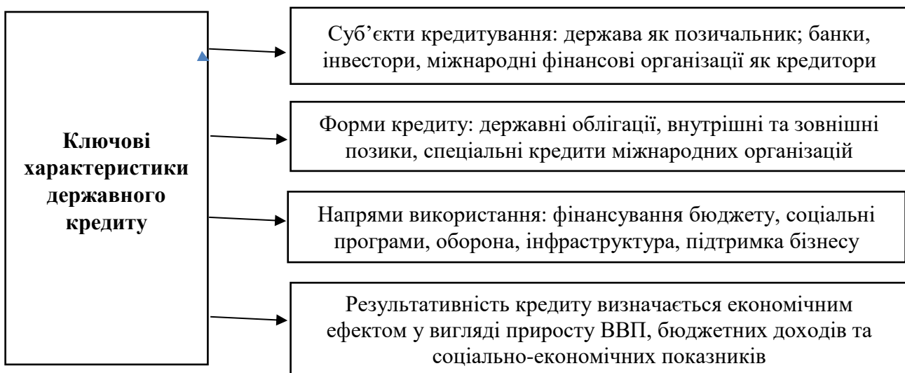
Рис.1.1. - Ключові характеристики державного кредиту

Ключові характеристики державного кредиту відображають його сутність, особливості функціонування та відмінності від інших форм фінансових відносин та схематично зображені на рис.1.1.