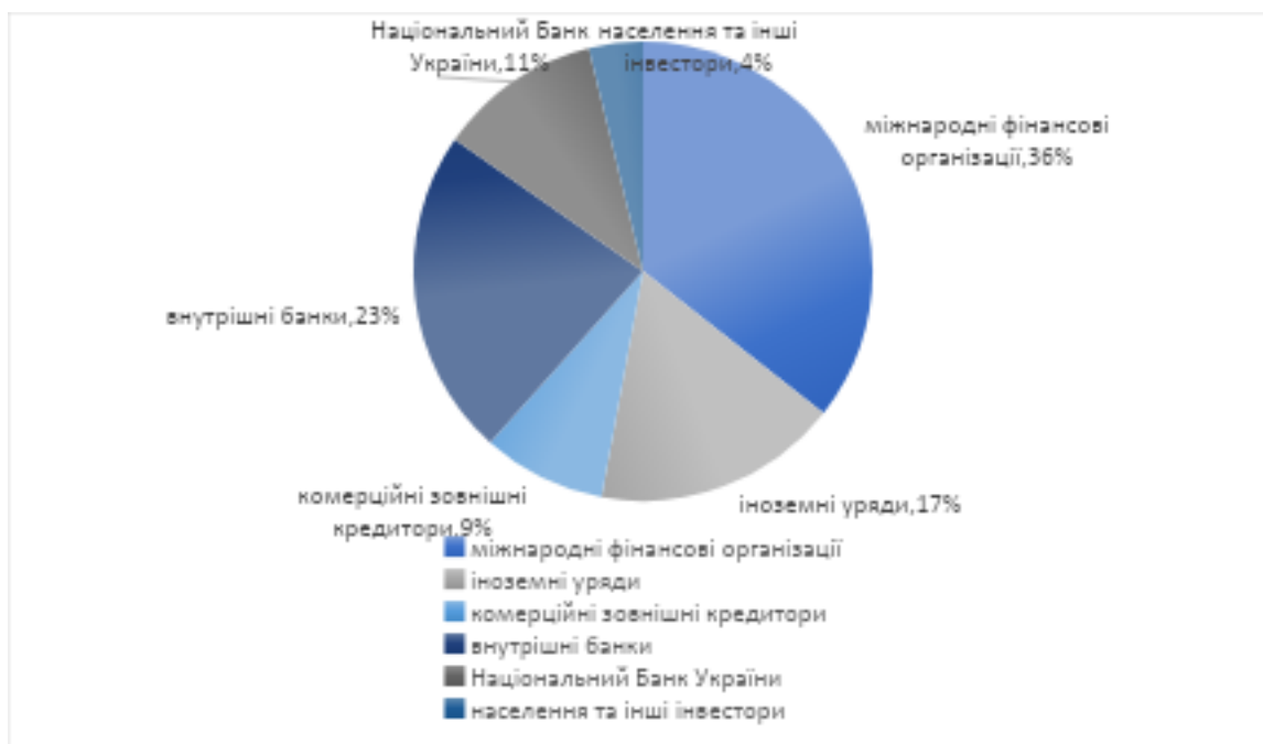
Рис.2.2. - Структура державного боргу України за типами кредиторів