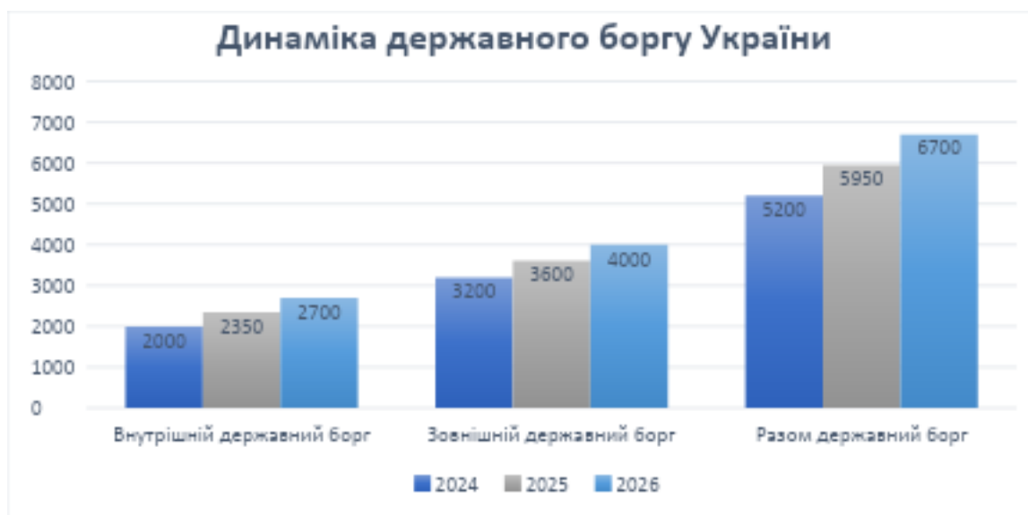
Рис.2.1. – Динаміка державного та гарантованого державою боргу України за видами за 2024–2026 роки (млрд.грн.)