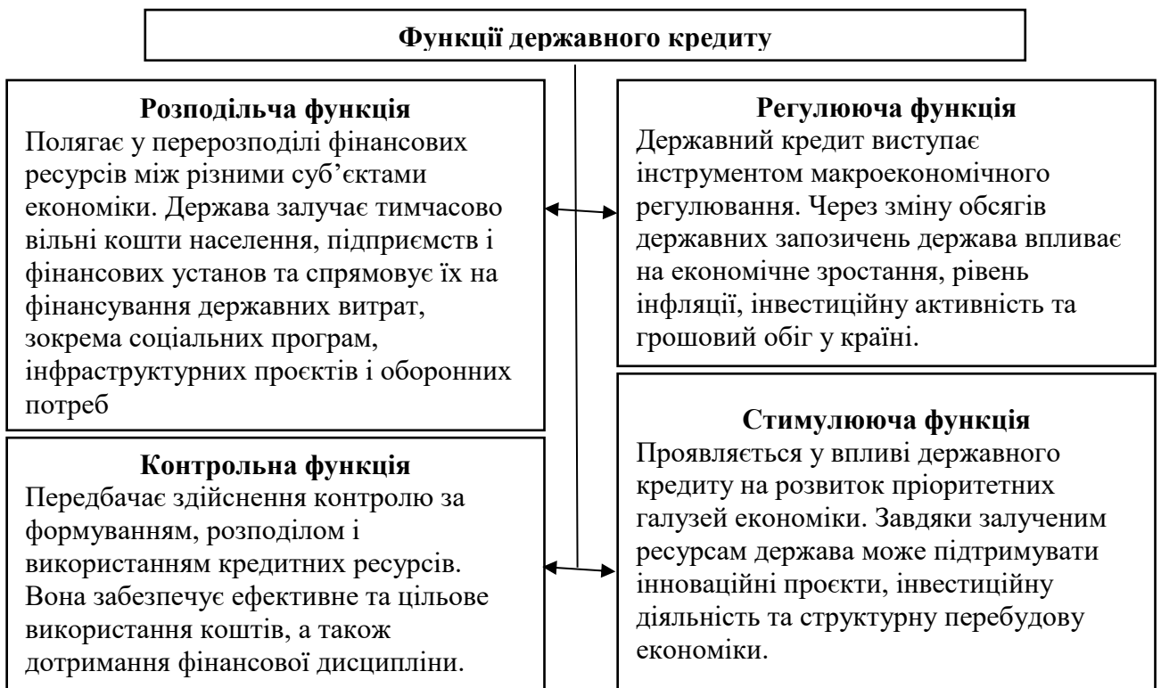
Рис.1.2. - Функції державного кредиту

Функції державного кредиту відображають його роль у фінансовій системі і вплив на економічні процеси, та схематично зображені на рис.1.2.