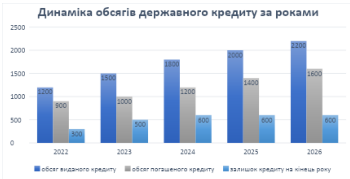
Рис.2.4. – Динаміка обсягів державного кредиту за роками (млрд.грн.)

поступово знижується з 25 % у 2023 році до 10 % у 2026 році, що свідчить про стабілізацію темпів запозичень.