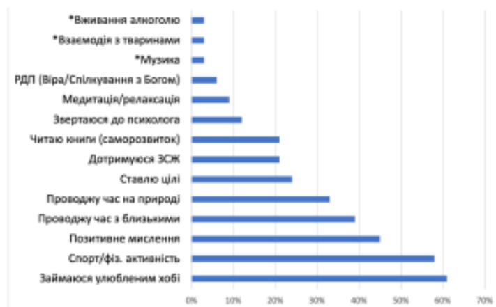
Рис. 2.2. Популярність використання конкретних стратегій підтримки психологічного благополуччя серед молоді

Крім того, було встановлено статистично значущий позитивний кореляційний зв'язок середньої сили ( \rho = 0,485 , p = 0,004 ) між кількістю стратегій самопідтримки, які використовує людина, та загальним рівнем її психоемоційного ресурсу. Отже, чим ширший і різноманітніший репертуар способів підтримання власного стану та чим частіше вони застосовуються, тим вищими є показники внутрішньої стабільності та життєвої врівноваженості респондентів.