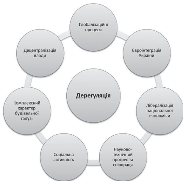
Рис. 2. Передумови дерегуляції будівельної галузі

Зазначені передумови, що впливають на процеси дерегуляції у будівництві, можуть стати суттєвим поштовхом до якісно нових змін у галузі будівництва, що, зокрема, спостерігалось у країнах, які перейняли міжнародний досвід та застосували дерегуляторну політику.