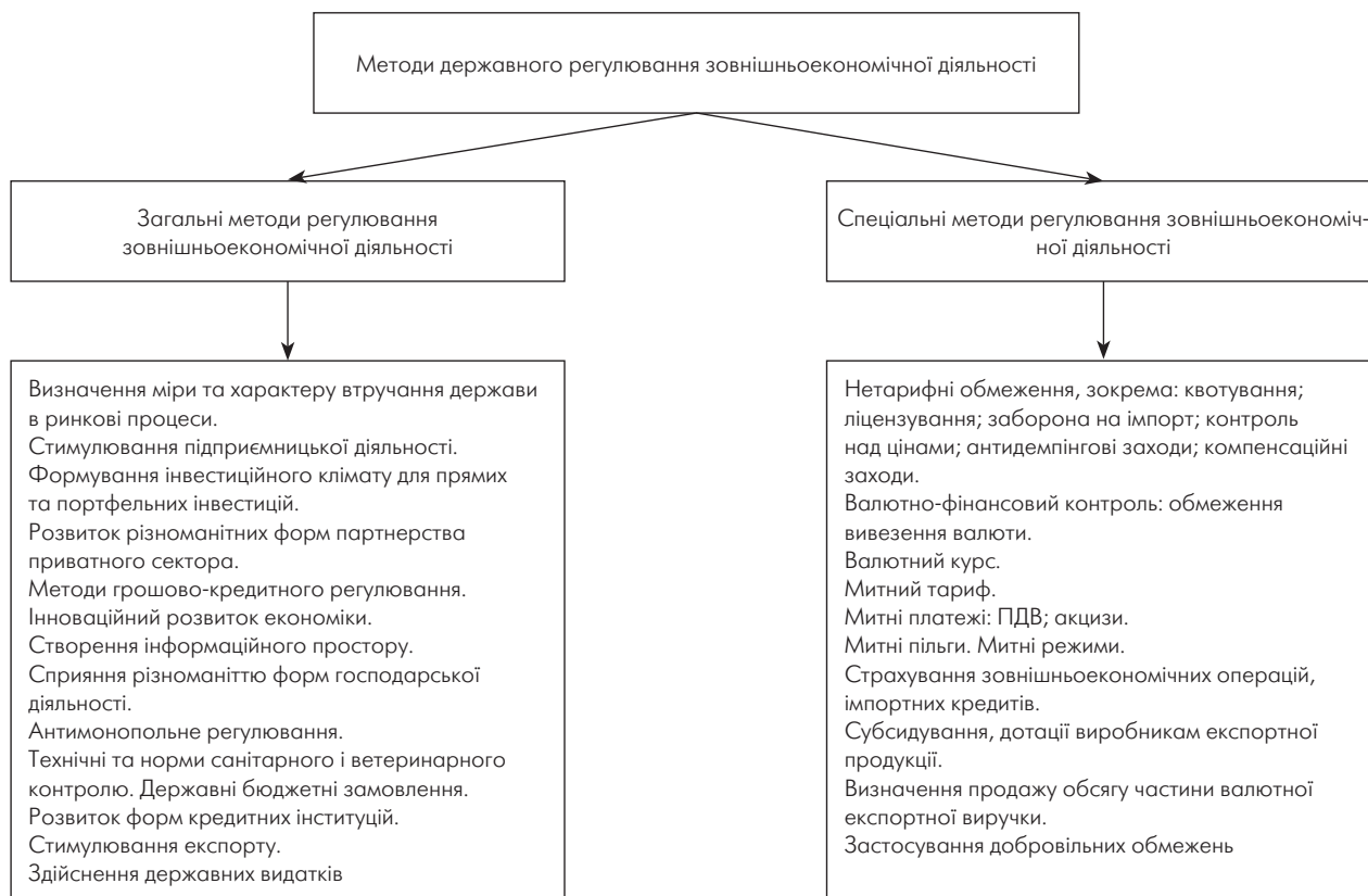
Рис. 2. Методи державного регулювання зовнішньоекономічної діяльності

Не менш важливою є й інша мета — показати, що державне регулювання зовнішньоекономічної діяльності не може бути відірване від регулювання національної економіки в цілому (рис. 2). Пропонована система не випадково будується на попередньому аналізі загальноєкономічного аспекту державного регулювання з акцентом на економічному регулюванні. Це дає змогу перейти до методів цілеспрямованого стимулювання приватного підприємництва у напрямі розвитку матеріального виробництва, впровадження високих технологій, підвищення конкурентоспроможності готової продукції — найважливішої умови посилення українського експорту.